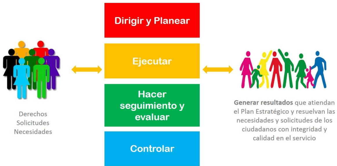
Figura No. 1

El MIPG es un marco de referencia para dirigir, planear, ejecutar, hacer seguimiento, evaluar y controlar la gestión de las entidades y organismos públicos, con el fin de generar resultados que atiendan los planes de desarrollo y resuelvan las necesidades y problemas de los ciudadanos, con integridad y calidad del servicio, según dispone el Decreto 1499 de 2017.