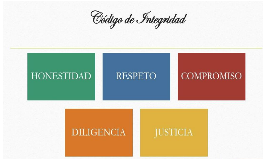
Figura No. 2.

Que conforme al Decreto Nacional 1499 de 2017 y al Manual Operativo de Gestión MIPG, los “Valores del Servicio Público – Código de Integridad”, deben hacer parte del engranaje de todas las entidades de la Rama Ejecutiva con la inclusión de este en el componente de Política de Talento Humano dentro del Modelo Integrado de Planeación y Gestión de cada entidad.